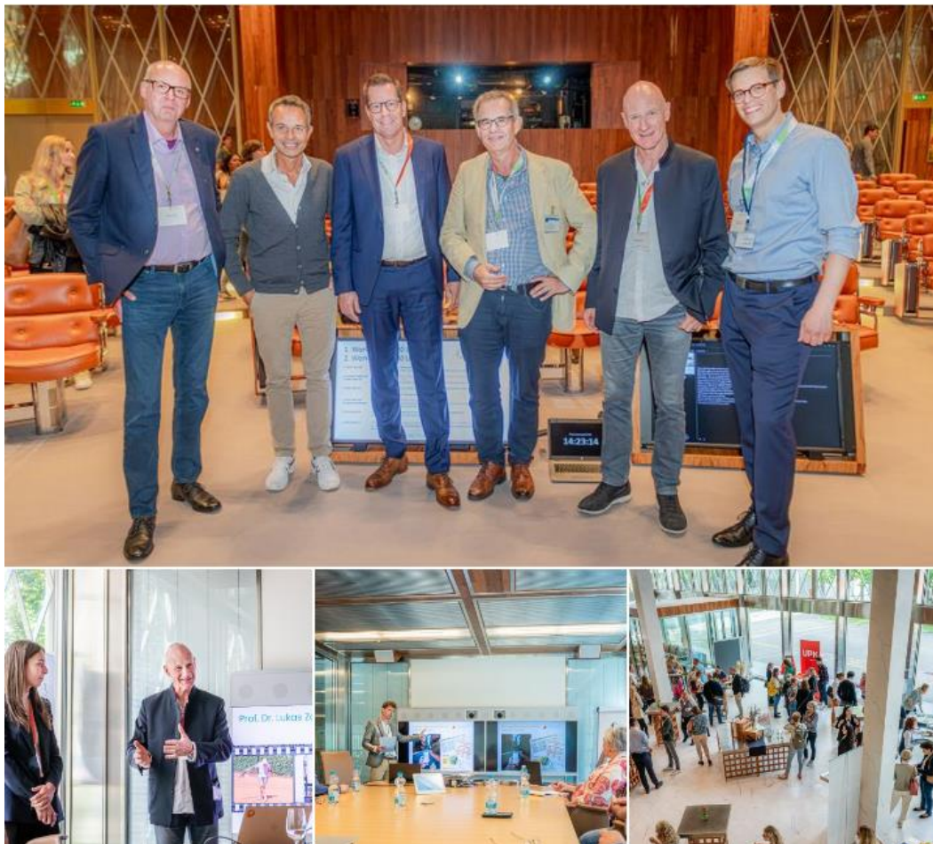
Abbildung 1: Impressionen zur Jahrestagung bei Novartis Pharma AG.